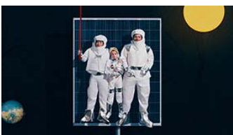
Voyage à travers le groupe Swiss Life

Swiss Life Holding SA, domiciliée à Zurich, trouve son origine dans la Caisse de Rentes Suisse (Schweizerische Rentenanstalt), fondée en 1857. L'action de Swiss Life Holding SA est cotée à la bourse suisse SIX Swiss Exchange (SLHN). Le groupe Swiss Life détient également les deux filiales Livit et Corpus Sireo. Il emploie environ 7600 collaborateurs et environ 4600 conseillers financiers licenciés.