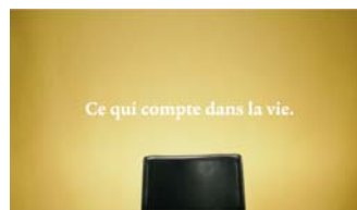
Ce qui compte dans la vie